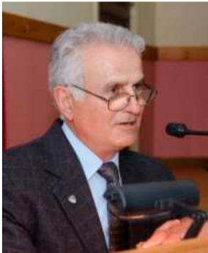
Χρήστος Γιανταμίδης Πλοίαρχος (ε)ε.α. Πολεμικού Ναυτικού

Η υπογεννητικότητα στην χώρα μας θα επιφέρει ανεξέλεγκτες επιπτώσεις και διαστάσεις, γιατί ένεκα αυτής, η Ελλάδα συρρικνώνεται πληθυσμιακά, κατά συνέπεια να απειλείται η πολιτισμική μας συνέχεια, η εδαφική μας ακεραιότητα, η εθνική μας ανεξαρτησία και η επιβίωσή μας ως Έθνος. Η υπογεννητικότητα είναι ένας υπαρκτός κίνδυνος, είναι μια ωρολογιακή βόμβα στα θεμέλια της χώρας μας, και πάνω από οποιαδήποτε οικονομική και πολιτική κρίση. Είναι ένα διαχρονικό εθνικό ζήτημα ΑΦΕΛΛΗΝΙΣΜΟΥ.